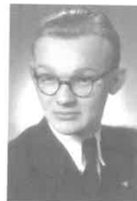
Manželka a děti s rodinami

Morální hodnoty a zásady, jež si vštípil mezi svými vrstevníky, soboteckými skauty, ctil a dodržoval po celý svůj život.